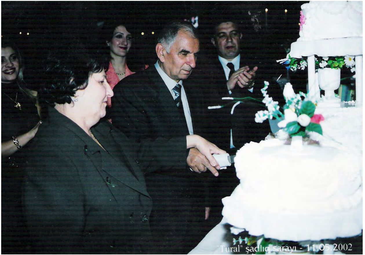
"Tural" şadlıq sarayı - 11.05.2002