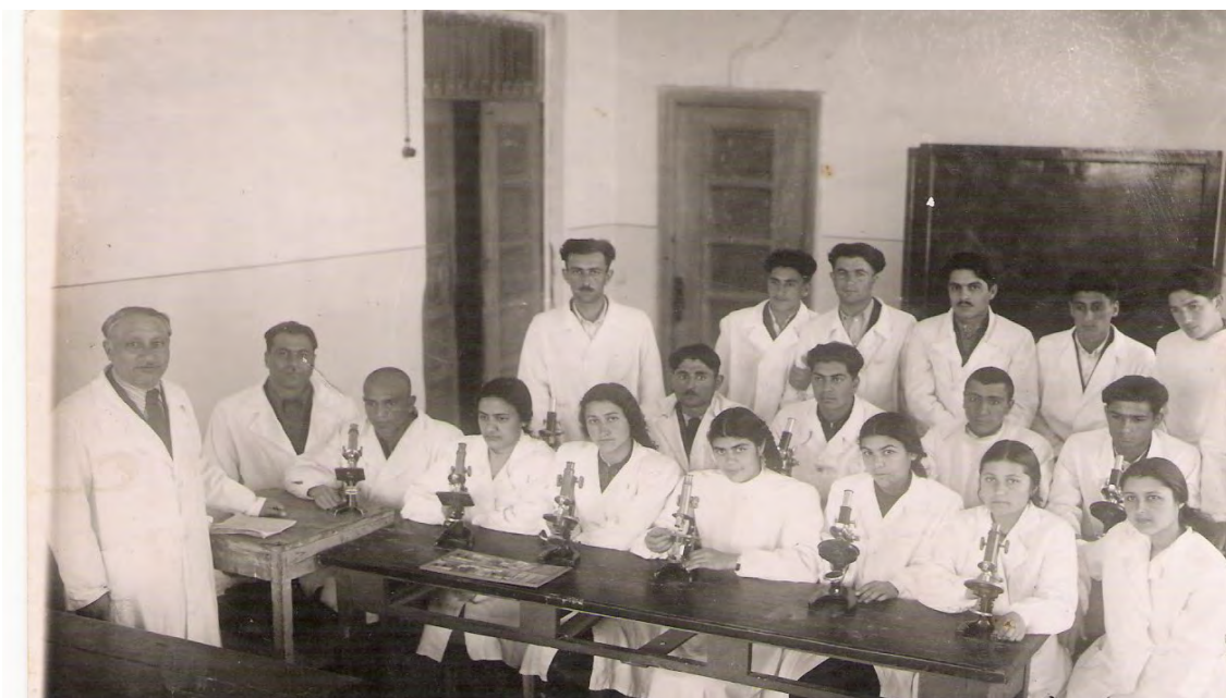
Histologiya və embriologiya fənnindən seminar zamanı (1949-cu il)