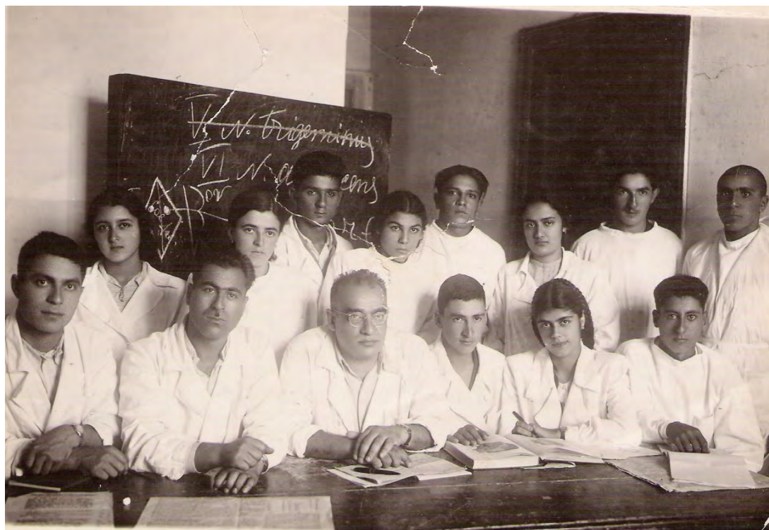
İnsanın normal anatomiyası fənnindən seminar zamanı (1950)