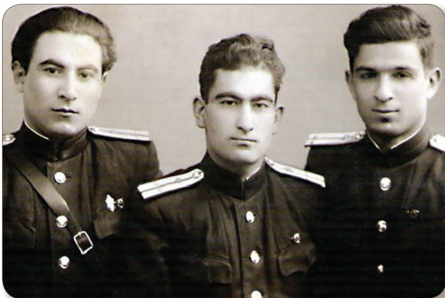
Murmansk, hərbi hospital (1956-1957)