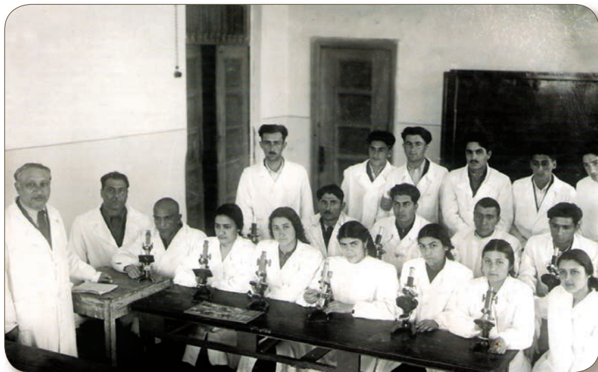
Histologiya və embriologiya fənnindən seminar zamanı (1949-cu il)