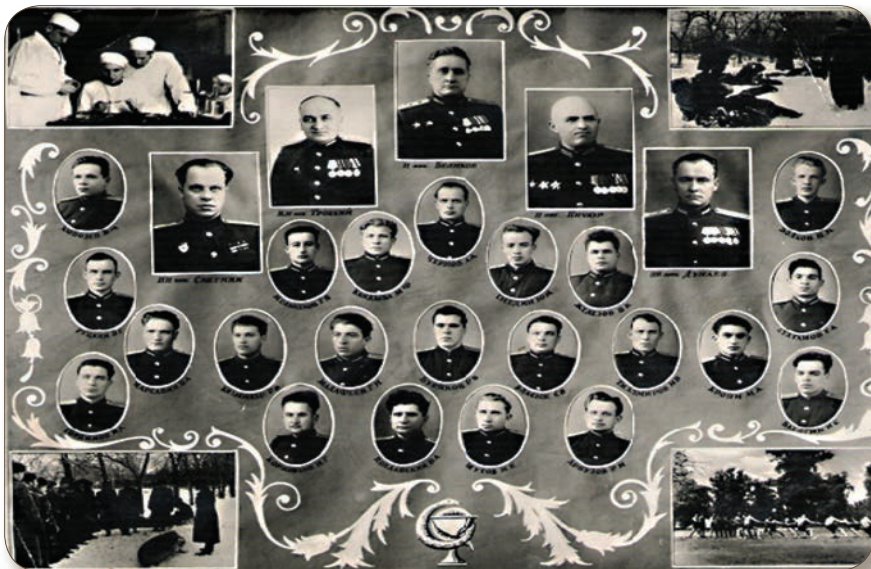
Samara Dövlət Tibb İnstitutunun hərbi tibb fakültəsinin 1956-cı il buraxılışının məzunları