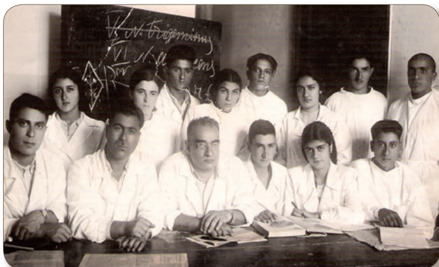
İnsanın normal anatomiyası fənnindən seminar zamanı (1950)